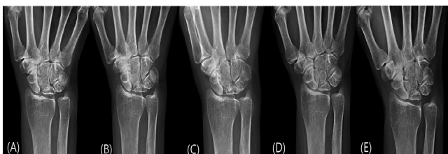
Fig. 2. X-ray of Right wrist. (A) June 14, 2023. (B) June 21, 2023. (C) June 28, 2023. (D) August 3, 2023. (E) May 27, 2024.

본원에 2023년 6월 12일 입원 후 2023년 6월 14일부터 1주일 간격으로 3회 촬영하였으며, 퇴원 후 2023년 8월 3일과, 2024년 5월 27일에 추가로 2회를 촬영함(Fig. 2).