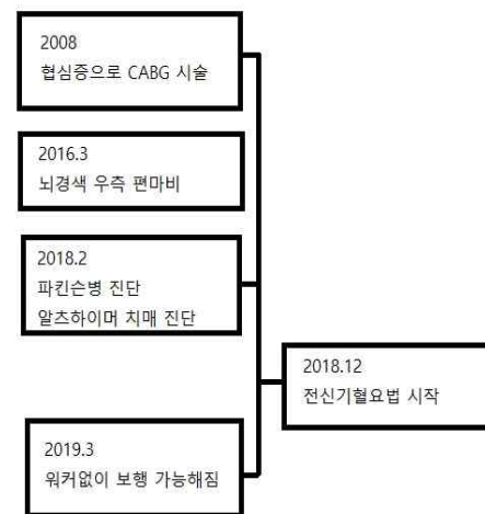
Fig. 1. Timeline of the patient.