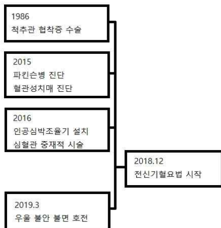
Fig. 3. Timeline of the patient.