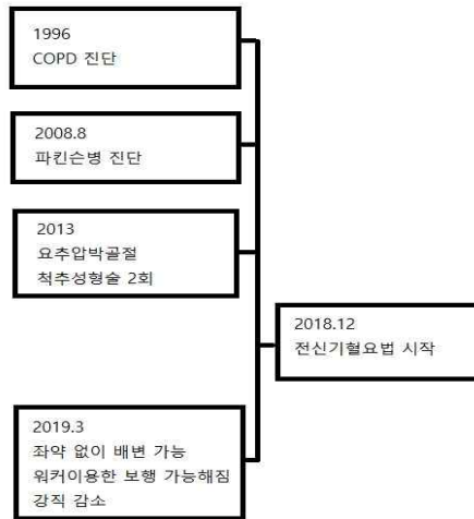
Fig. 2. Timeline of the patient.