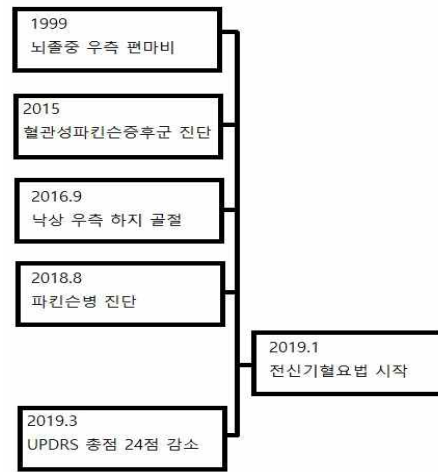
Fig. 4. Timeline of the patient.